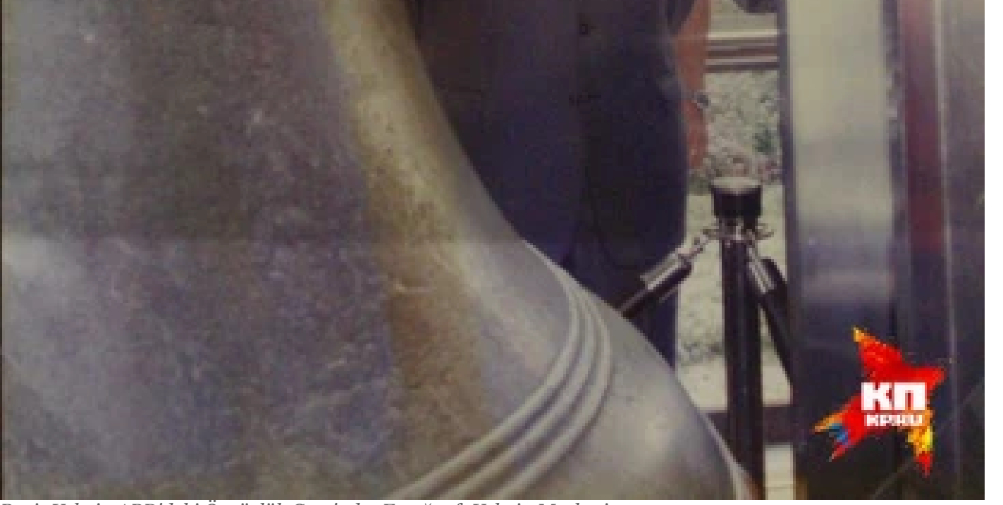
Boris Yeltsin ABD'deki Özgürlük Çanı'nda.

Başkan Bush: Boris, çağrını ve açık sözlülüğünü takdir ediyorum. Şimdi 16 noktanın tamamına bakacağız. Sizce merkezin tepkisi ne olacak?